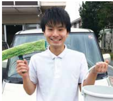
元気な若いスタッフがお伺いします