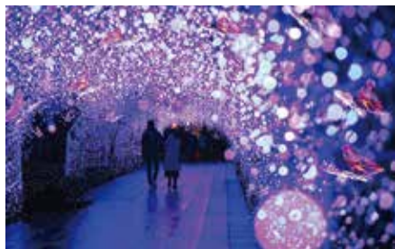
今年の「第7回イルミネーションアワード」イルミネーション部門で第2位受賞。昨年は総合エンタテインメント部門で第3位に。 ※江の島サムエル・コッキング苑、江の島岩屋は入場料が必要

いよいよクリスマスシーズン到来！ 地元・江の島をはじめ、小旅行気分でお出かけできる水族館や美術館のイルミネーションをご紹介します。澄んだ空の下、いつもとは一味違う光り輝く空間に、新たな魅力を発見できるはず。