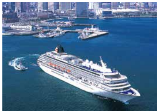
2020年春、リニューアルする「飛鳥II」

横浜発着 33万6000円 から 客室K:ステート、2人1室利用時 1人当たりの旅行代金