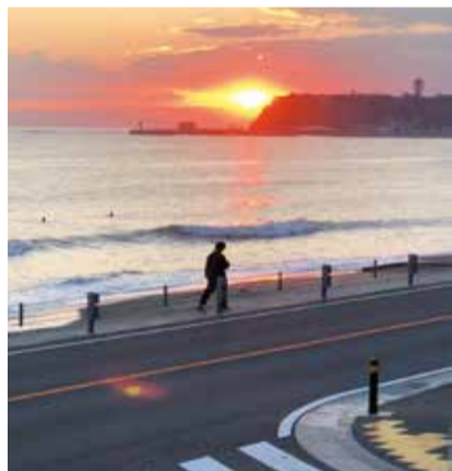
同墓苑から見た夕暮れの湘南。海を渡る風、潮の香りや波の音に囲まれた「海と眠る終の住処(すまか)」、それが「顕証寺墓苑」です