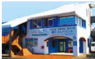
湘南エリア地域密着の会社。見積もりは無料です