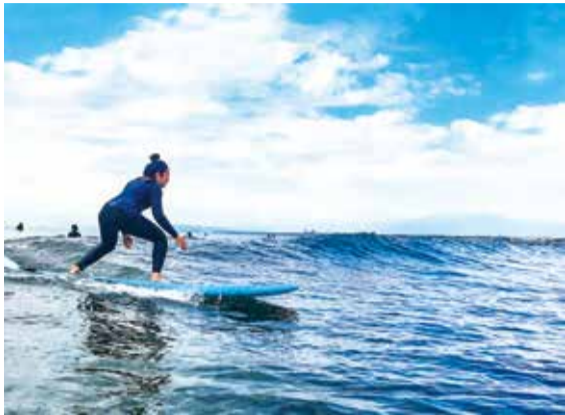
マリンスポーツの代表、サーフィンの魅力を知るきっかけにピッタリ。江の島の背景に、波と一体になれる感覚をあなたも実感して