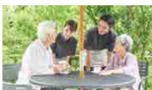
居心地がよい住まいを提供できるよう、日々のコミュニケーションを通じて、信頼関係を築いています

分で見学できる「プレミアムメニュー」を用意。目の前で寿司を握ったり、鉄板で焼いて仕上げたり、味だけでなくコミュニケーションも楽しめる時間が演出されています。 【資料・見学の問い合わせ】 【受け付け代行】リアン編集部 10:00~17:00(祝日を除く月~金曜) (12/26~1/3は休業) 0800-1700-255