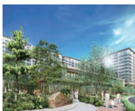
パークウェルステイト湘南藤沢SST