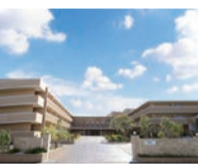
ネオ・サミット茅ヶ崎/湯河原