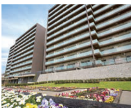
藤沢エデンの園 一番館