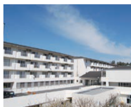
湯河原(ゆうゆうの里)