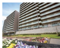
藤沢エデンの園 一番館