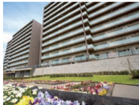
藤沢エデンの園 一番館

ミニセミナー 15:00～15:20 終活のまどぐち「知っておきたい!終活・相続準備」