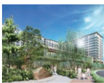
パークウェルステイト 湘南藤沢SST