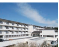
湯河原(ゆうゆうの里)