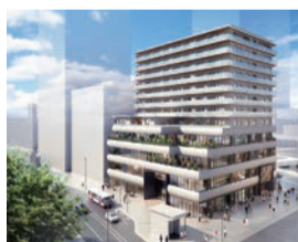
グランクレール網島