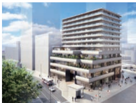
グランクレール網島

どのような設備やサービスを行っているのか、日常生活例など、各施設ごとに細かい説明が聞けます。