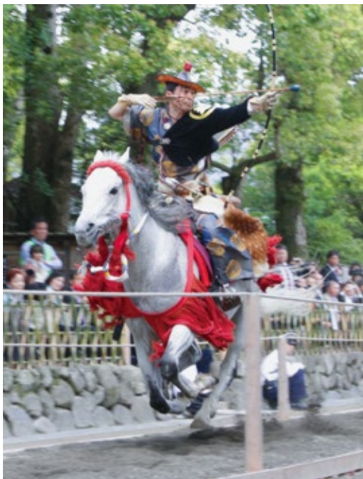
的を狙う射手。射手は脚で馬体を挟まず、鎧をよく踏み、鞍から紙一重で腰を浮かす「立ち透かし(たちすかし)」という技を駆使して騎乗します