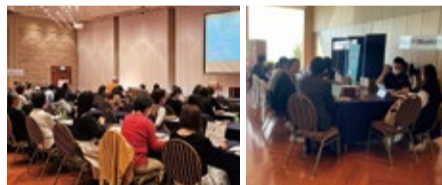
盛況だったセミナーとブースの様子