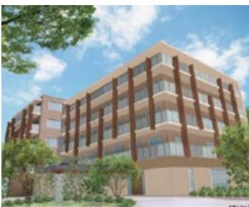
鉄筋コンクリート造の地上5階建て、全100室すべてが個室の「サニーステージ北鎌倉」