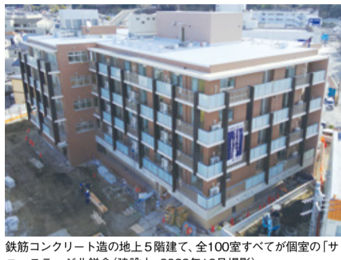
鉄筋コンクリート造の地上5階建て、全100室すべてが個室の「サニーステージ北鎌倉」(建設中、2023年12月撮影)