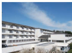
湯河原(ゆうゆうの里)