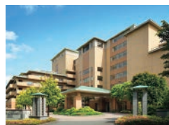
サンシティ神奈川(秦野)