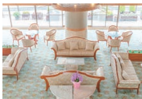
中銀ライフケア熱海【水口】 ロビー

10棟から構成される熱海の中高齢者専用マンション 充実した共用施設と「あったら便利」なサービスが魅力