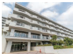
中銀ライフケア熱海