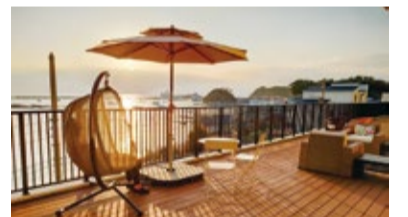
「海が好き」「富士山が好き」という60～90代の入居者がセカンドライフを謳歌(おうか)しています

入居者の健康管理には、スマートウォッチを利用。歩いた歩数、睡眠時間など日々の健康状態を管理する最先端のシステムを導入しています。このシステムは健康管理のみならず、ウォッチを装着して日々の生活を送る、アクティブに参加する、菜園でレストラン向けの野菜を栽培するなど、日常的な行動がポイントに還元され、ウォッチにたまり、仮想通貨として館内レストランなどのサービスに利用できます。「ためる楽しさが付加されたポイントシステムで毎日の生活に彩りが加わります。併せて、健康データの蓄積が容易になるのも行っています。