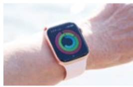
入居者全員が装着しているスマートウォッチ(上)で、運動のデータが蓄積されていきます

外の社会と交流する緊張感が健康増進に 装着したスマートウォッチが生活習慣改善にも