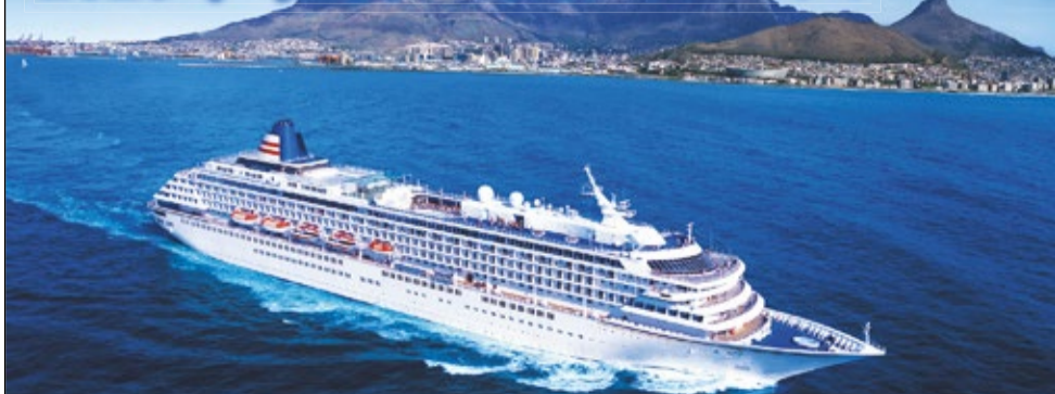
飛鳥II ケープタウン