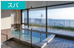
オーシャンビューのスパにはサウナ、マッサージチェアも