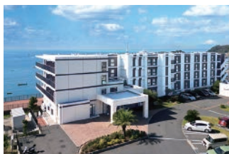
マゼラン 湘南佐島