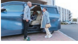
駅や病院など近隣への送迎や、外食、買い物などサポートにも対応 ※一部有料サービス