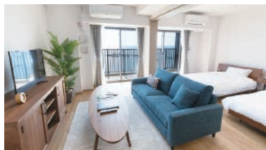
総部屋数は50室。部屋タイプは1Rから2LDKまで5種類。全ての居室の寝室・浴室・トイレには緊急コールボタンが設置されています。プランによっては施設内での住み替えの相談も可能だそう

2022年12月に開業した横須賀の老人ホーム。60歳から入居OK、介護・支援認定を受けていない人のための住まいで、一般の人も参加する館内ワークショップやイベントを通じて、社会参加や多世代交流が盛んに行われています。また起業・就労支援を利用して社会復帰する人もいます。入居者はホームで毎日を謳歌する人、自炊し、無料定期便で逗子・葉山駅から都内に出勤する人、セカンドハウスとして利用する人などさまざまです。