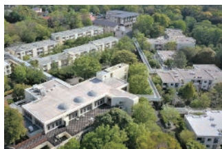
伊豆高原(ゆうゆうの里)