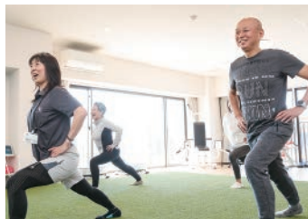
入居者全員が装着しているスマートウォッチ(上)で、運動のデータが蓄積されています

外 の 社 会 と 交 流 す る 楽 し い 緊 張 感 が 健 康 増 進 に 装 着 し た ス マ ー ト ウ オ ッ チ が 生 活 習 慣 改 善 に も 一般開放されているレストランやカフェ、フィットネススタジオ、海が見えるスパもある「健康型有料老人ホーム マゼラン 湘南佐島」。「外の社会と積極的に交流することで、そこに会話が生まれ、コミュニティができ、身だしなみにも気を配れるようになりま