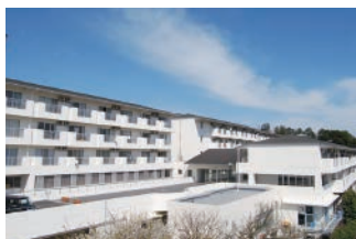
湯河原(ゆうゆうの里)