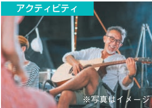
アクティビティは土日を除く毎日実施。日帰り温泉や、映画鑑賞、プロ野球観戦などなど。アクティビティ参加でスマートウォッチにポイントがたまりま