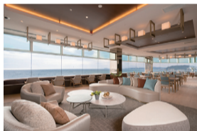
全面オーシャンビューの展望ダイニングは最上階に

温泉付きリゾートホテル併設の老人ホームで充実した第二の人生を 相模湾を眼下に、心癒やされる景色とホスピタリティーあふれる住空間を提供