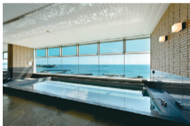
「葉山うみホテル」内の温泉も利用できます

“ホテルのような住空間とおもてなし”がコンセプトの「葉山うみのホテルサービスレジデンス」。リゾートホテル併設の住宅型有料老人ホームは、今年6月に開設4周年を迎えました。横浜横須賀道路「逗子IC」から逗葉新道を通って車で10分という好アクセス。穏やかな波が打ち寄せる森戸海岸のすぐ近くにあり、ホテルのラウンジや温泉などの共用施設を利用できるとあって、面会に併設ホテルを利用する家族も多いそう。