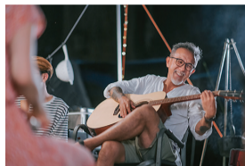
毎日開催される体験型アクティビティは、木彫り体験・ジャズ体操など多彩

介護・支援認定を受けていない人の住まいとして、2022年12月、横須賀に開業した「マゼラン 湘南佐島」。入居は60歳からで、毎日をホームで謳歌する人、毎日都内まで出勤する人、ホームをセカンドハウスとして利用する人など、入居者のタイプもさまざま。一般開放されているレストランやカフェ、スパ、そして外部の人も参加するワークショップやイベントを通じ、社会参加や多世代交流が盛んに行われています。