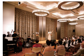
ダンスや各種コンサートが定期的に開催される「サンシティホール」

“都市にある海辺のリゾート”がコンセプト。横浜コットンハーバー地区の「サンシティみなとみらいEAST」は、地上9階建て、居室数228室の大規模住宅型有料老人ホーム。眼下に広がる横浜港の絶景はこの施設ならではの。入居時自立（70歳以上）の人が対象で、ロビーラウンジにプールやピリヤードといった娯楽施設があり、会員制リゾートホテルのような住空間の中で思い思いのセカンドライフが過ごせます。