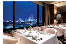
みなとみらいの夜景を見ながら食事を楽しむ最上階のレストラン

会員制ホテルのような住空間で送る充実のセカンドライフ 眼下に広がる横浜港の絶景を見ながら楽しむ食事は代えがたい至福のときに