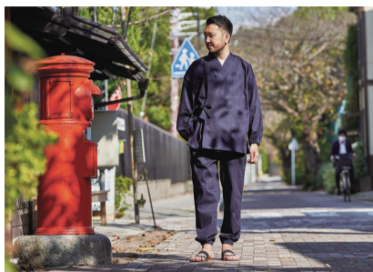
デニム (PALPA・イージーケア) 作務衣 (3万2670円)

「作務衣」は、もともと禅宗の修行僧の作業着のこと。作業着でありながら僧侶の品格を表現するとともに、掃除や庭仕事、料理などさまざまな場面で着用することから、利便性も重視されてきました。