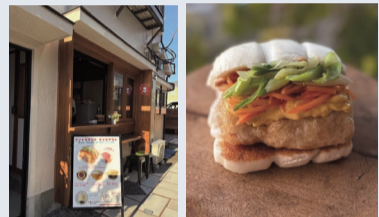
店頭でせいろで、あつあつのマントウを提供。写真は「大トロまぐろのフリット」