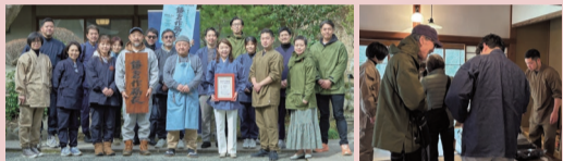
毎年3月6日には「鎌倉作務衣の日」のイベントが浄智寺で開催されています

「鎌倉作務衣の日」に合わせて、浄智寺(鎌倉市山ノ内1402)で、新製作務衣の展示・販売会が開かれました。これは、メーカーズシャツ鎌倉が実施している、今年で4回目の展示イベント。会場では9種類の商品を展示。展示会は「たまたま観光で訪れた」という外国人観光客や招待客など、たくさんの来場者で賑わいました。