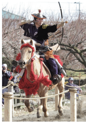
2024年9月に鎌倉市深沢から稽古場を移転した大日本弓馬会。新馬場は、鎌倉市関谷に新設されます