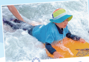
キッズクラブの活動

湘南の青い海とスポーツで、子どもの心と体を育ててみませんか？ 4歳から大学生、大人までを対象にした、会員制マリンスポーツクラブ「江ノ島ちよっとヨットビーチクラブ」では、2026年度の新規メンバーを募集しています。リオ五輪セーリング競技日本代表・宮川恵子さんが、キッズやジュニア、ユースの育成や指導者・インストラクターの育成を行っており、基礎からハイレベルなスキルを学べるのが魅力です。