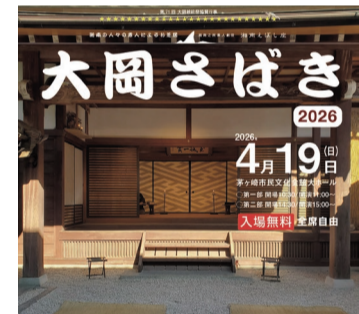
時代劇のテーマは「AIと妖怪」。今年は、さまざまな楽しい仕掛けが満載です