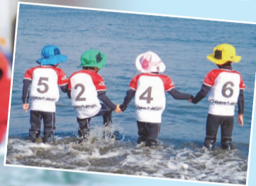
キッズクラブの活動