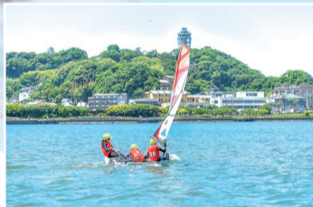
説明会では、活動風景を陸上から見学するので、子どもたちのイキイキとした姿や潮風を受けて海上を走る様子が見られます