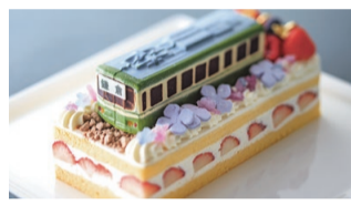
アジサイの中を走る江ノ電がモチーフの「江ノ電ケーキ」(6800円)を販売。来年3月31日(水)まで、1日1個限定

早いもので、もうすぐ初夏。鎌倉を代表するアジサイの季節がやってきます。「鎌倉プリンスホテル」にあるレストラン・トリアノでは7月7日(火)まで、季節感あふれる2つのメニューが登場しています。 乙女心くすぐる「紫陽花アフタヌーンティー」では、紫陽花風琥珀糖、紫陽花どら焼きなど、13種類のスイーツに、セイボリーが彩り豊かに。合わせて黒毛和牛と豚のハンバーグステーキ、茄子とモツアレラチーズのトマトパスタなど、好きなメニュー料理を選んで、オードブルやスープ、パン、デザート好きなだけチョイスする「初夏のハーフブッフェランチ」も開催されています。 また、1日1個限定販売の「江ノ電ケーキ」(右写真)が期間限定で登場。江ノ電好きにはたまらないケーキです。ホテル棟3階の「ラウンジ あじさい」で販売しています。要予約。 「ホテルのような住空間とおもてなし」がコンセプトの住宅型有料老人ホーム「葉山うみのホテルサービスレジデンス」は、今年6月に開設6周年を迎えます。「葉山うみのホテル」に併設した複合施設であるのも特徴で、自立度の高い入居者はホテルのラウンジや温泉などの共用施設も利用できます。居室は1人部屋と2人部屋の個室で、いずれもプライバシーを重視。60代から100歳まで、さまざまな入居者が生き生きと毎日を過ごしている、「老人ホーム」というより「快適な高齢者の住まい」という印象が強い施設です。葉山うみのホテルサービスレジデンスは、元気がなうちから要介護5まで入居が可能で、看取りまで対応。入居者の体調や健康に対する不安に、関と連携し、健康面を徹底サポートしています。