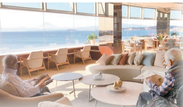
眼下には相模湾が。最上階にあるオーシャンフロントのダイニング